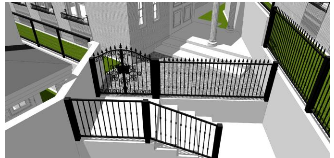
＜ 玄関までのアプローチと門扉・フェンス位置の確認 ＞