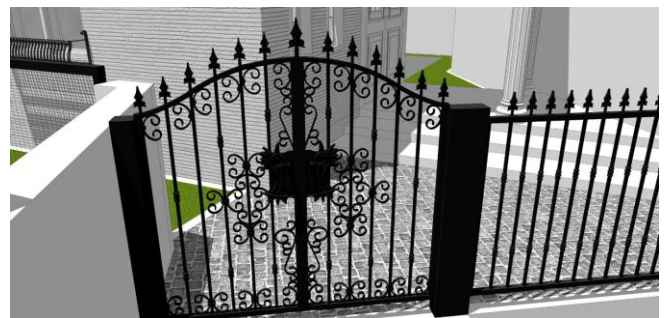
＜ 門扉の形状確認と高さのバランスなどを検証 ＞

当スキルアップでは、施主さまとの認識トラブル回避・理解力の向上をサポートしつつ、施工会社さまの立場にたった合理的なプレゼンテーションをご提供してまいります。この機会に、「3D活用法の案内」をご確認のうえ、E-mail、もしくはお電話などにて、お問い合わせいただければ幸いです。是非、当社ホームページにて、3Dを利用したプレゼンテーションをご覧ください。