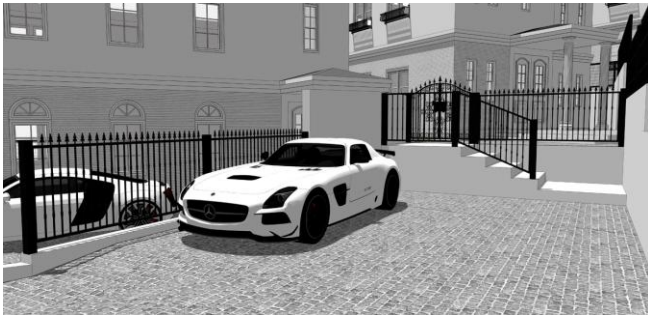
＜ 駐車スペースからエントランスまでのアプローチ ＞